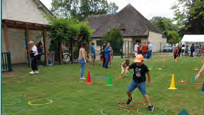
Le pré de la cour d'école lors de la kermesse